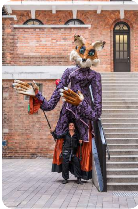
Mademoiselle Renarde Charmante et rusée