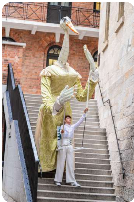
Mademoiselle Cigogne Gracieuse et candide