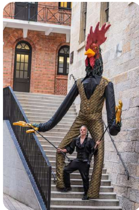
Monsieur Coq Fier mais froussard