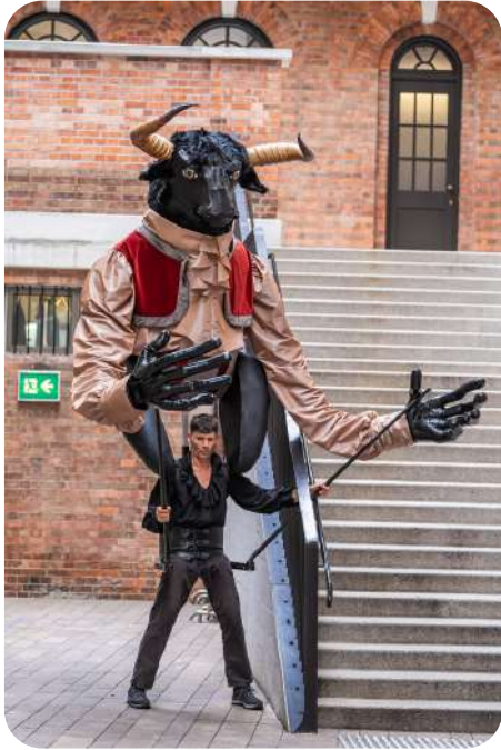
Monsieur Bœuf Opiniâtre et flegmatique