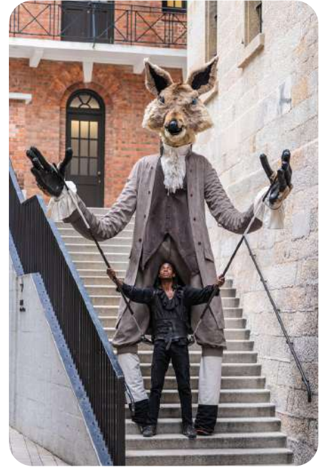
Monsieur Loup Majestueux et terrifiant