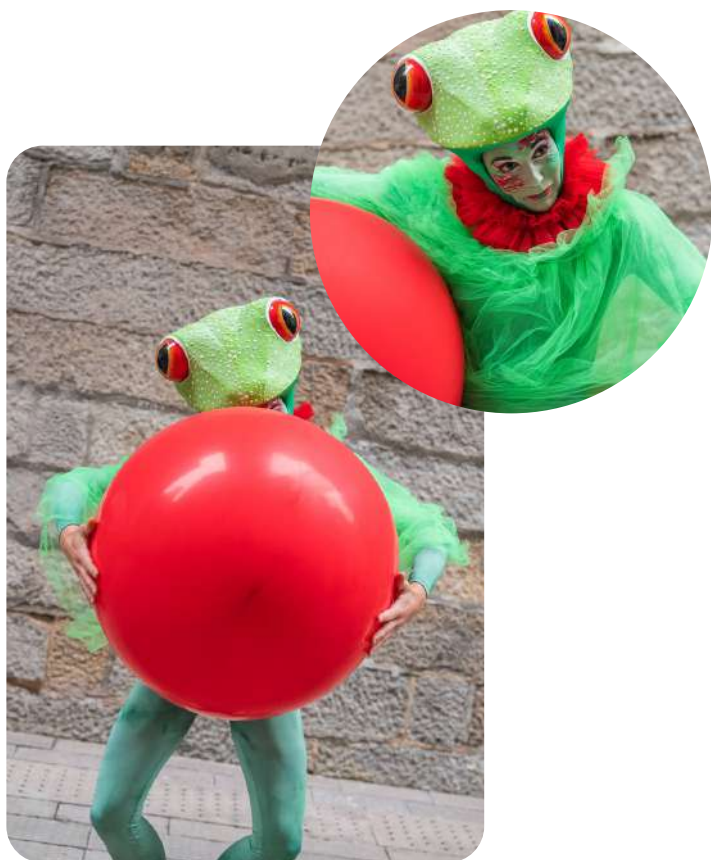
Madame Grenouille Frénétique et passionnée