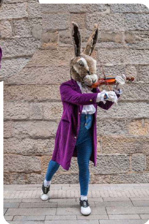
Monsieur Lapin Emotif et distingué